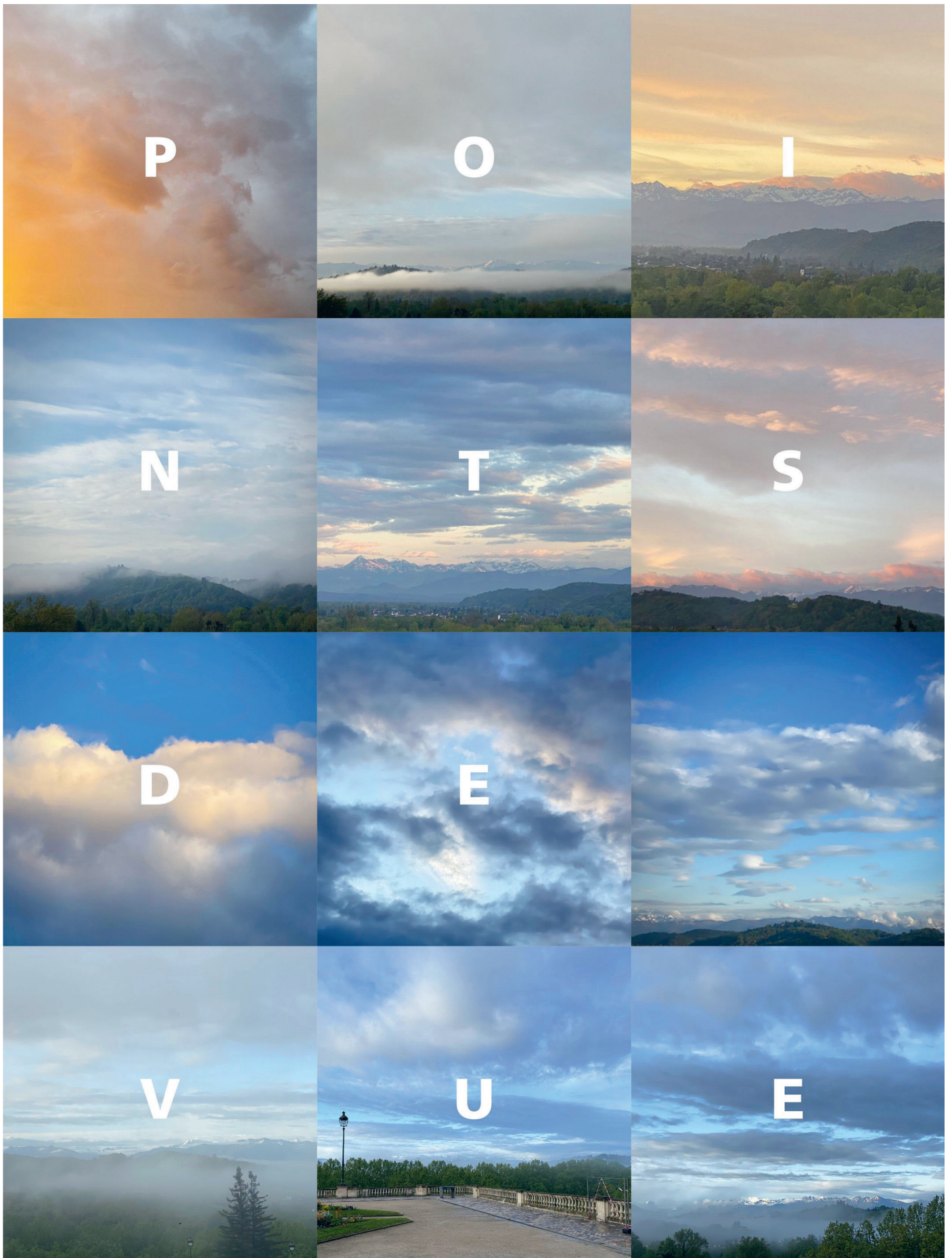
Une des pages de rubrique du n° 3 de la revue – Les pages de couvertures et de rubrique ont été spécialement créées par les designers Marie Bruneau et Bertrand Genier..