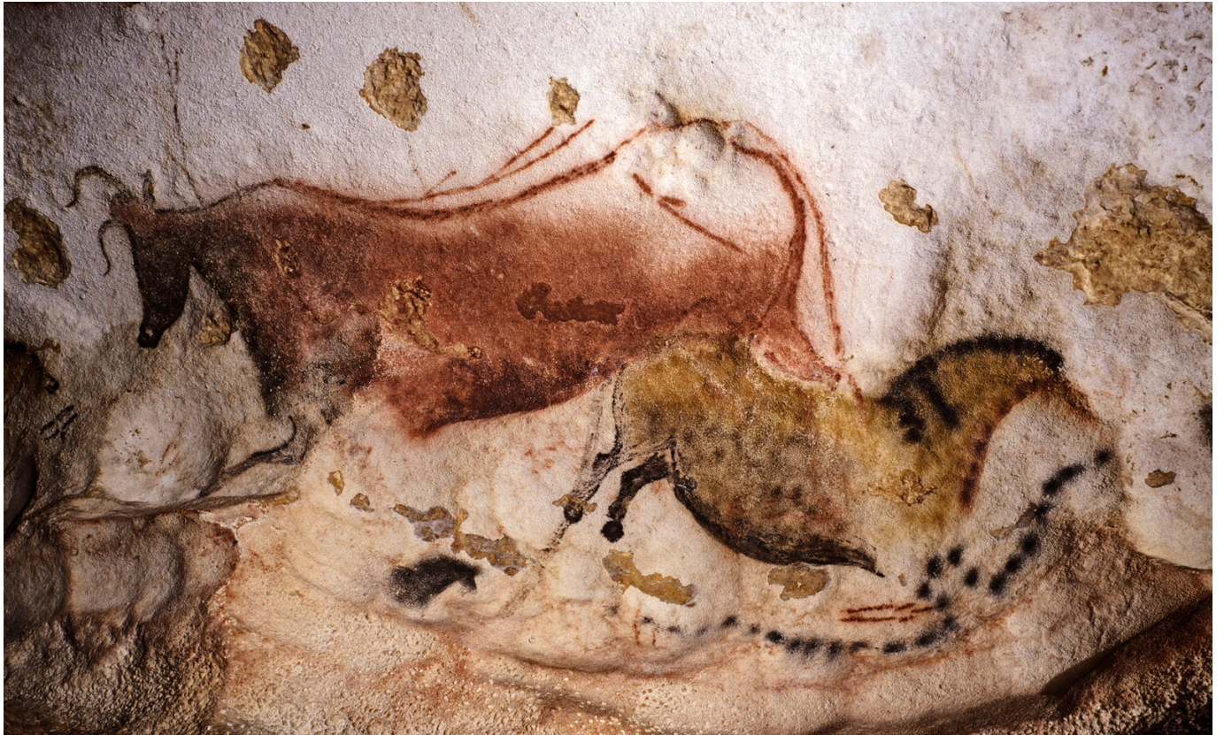
Article « Le sens de la trace matérielle dans l'art paléolithique » de Marc et Marie-Christine Groenen- Lascaux (Dordogne), Diverticule axial, premier « cheval chinois » et aurochs.