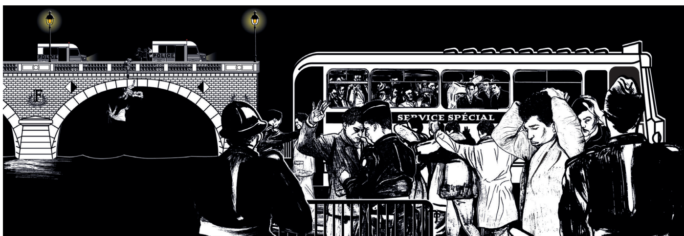
Article « Le geste artistique graphique, témoin ou acteur de la transformation urbaine ? » – Fresque commémorative de la répression meurtrière de la manifestation du 17 octobre 1961 par les soeur Chevalme .