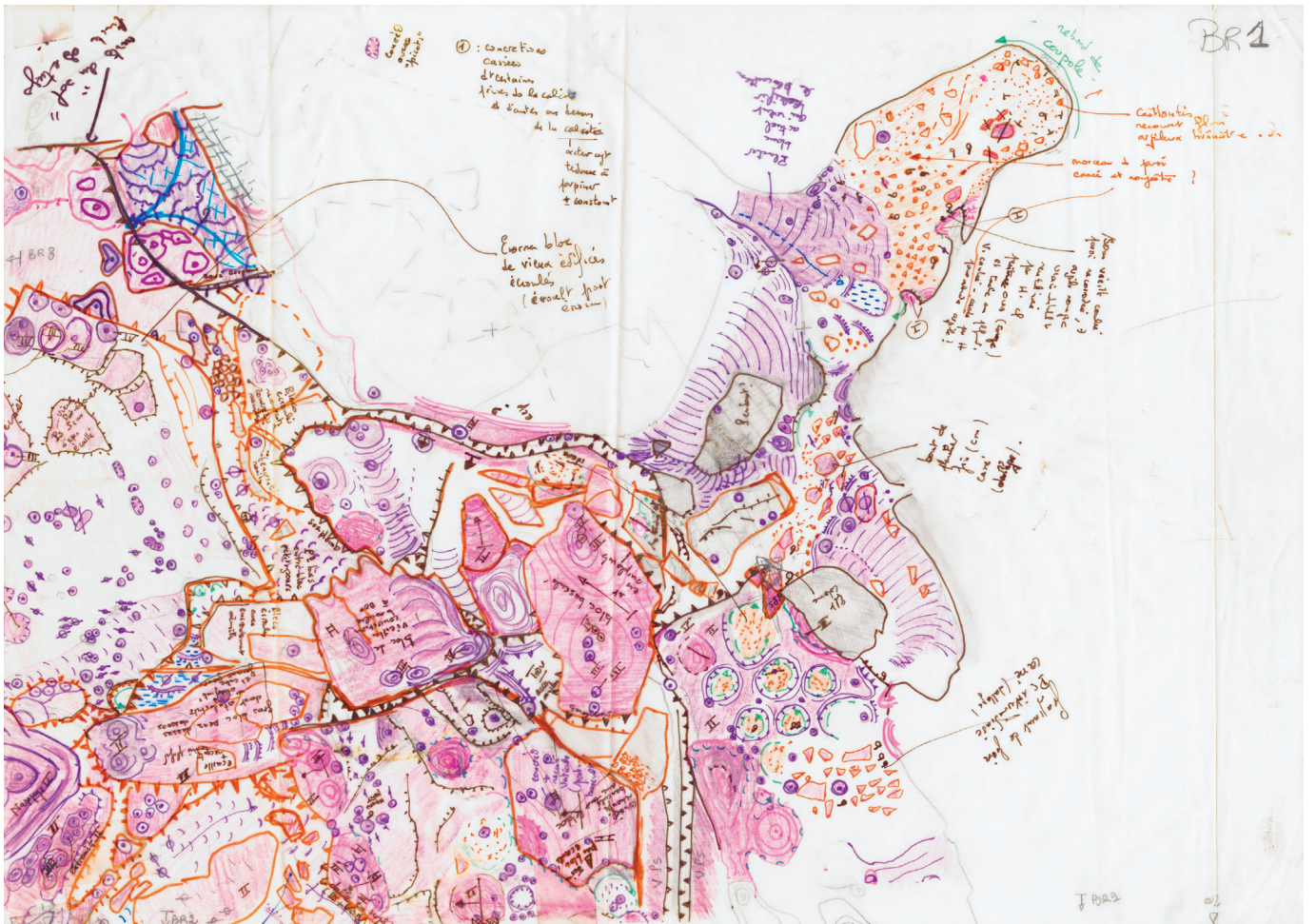
Article « Images cartographiées d'une grotte ornée » de Jean-Jacques Delannoy, Jean-Michel Geneste, Laurent Bruel et Alexandre Dimos – Relevé manuel du sol de la grotte Chauvet (dit « minute de terrain ») par Jean-Jacques Delannoy, ouverture de la partie 3 de l'Atlas de la grotte Chauvet-Pont d'Arc, page 154.